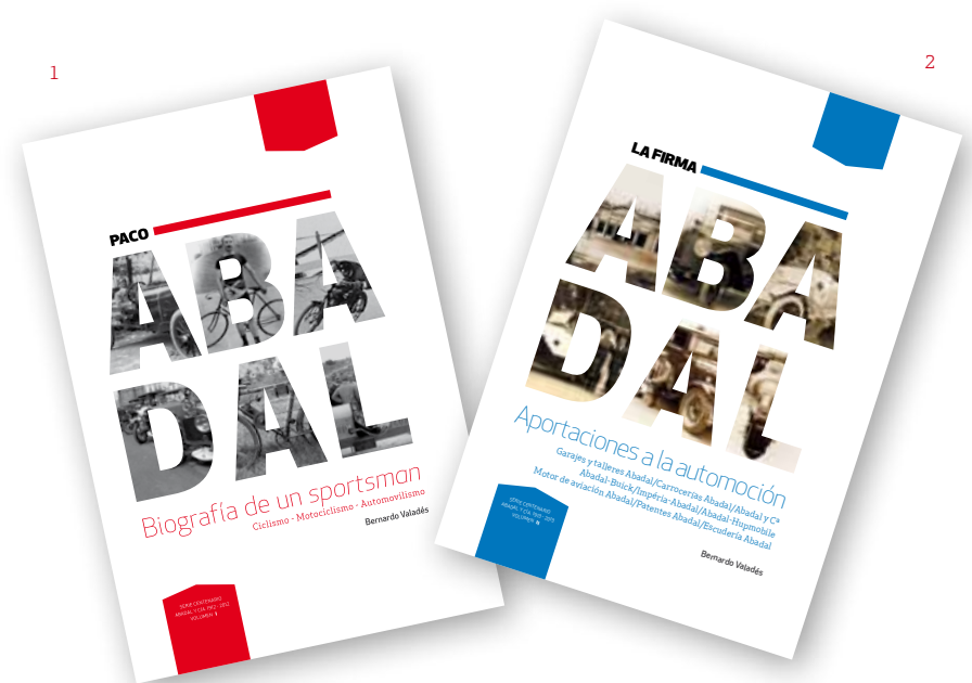
1. Portada de "Biografía de un sportsman". 2. Portada de "Aportaciones a la automoción".

Un hito de esta magnitud no puede pasar inadvertido para los teóricos, los expertos, los historiadores y los aficionados de la automoción y, por supuesto, para quienes administran lo público.